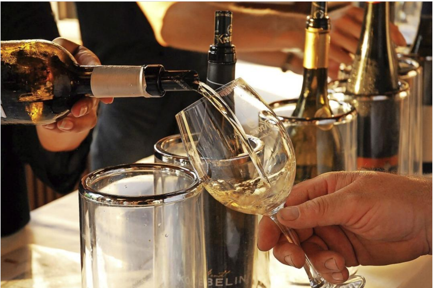
Die Rebsorte Grauburgunder ist nach wie vor beliebt und liegt im Trend.

BZ-Plus | Der Naturgarten Kaiserstuhl und der Badische Weinbauverband zeichnen wieder die besten Winzer aus. Die Jury bewertet 417 Weine. Am 10. Juli werden sie im Weingut Köbelin in Eichstetten vorgestellt.