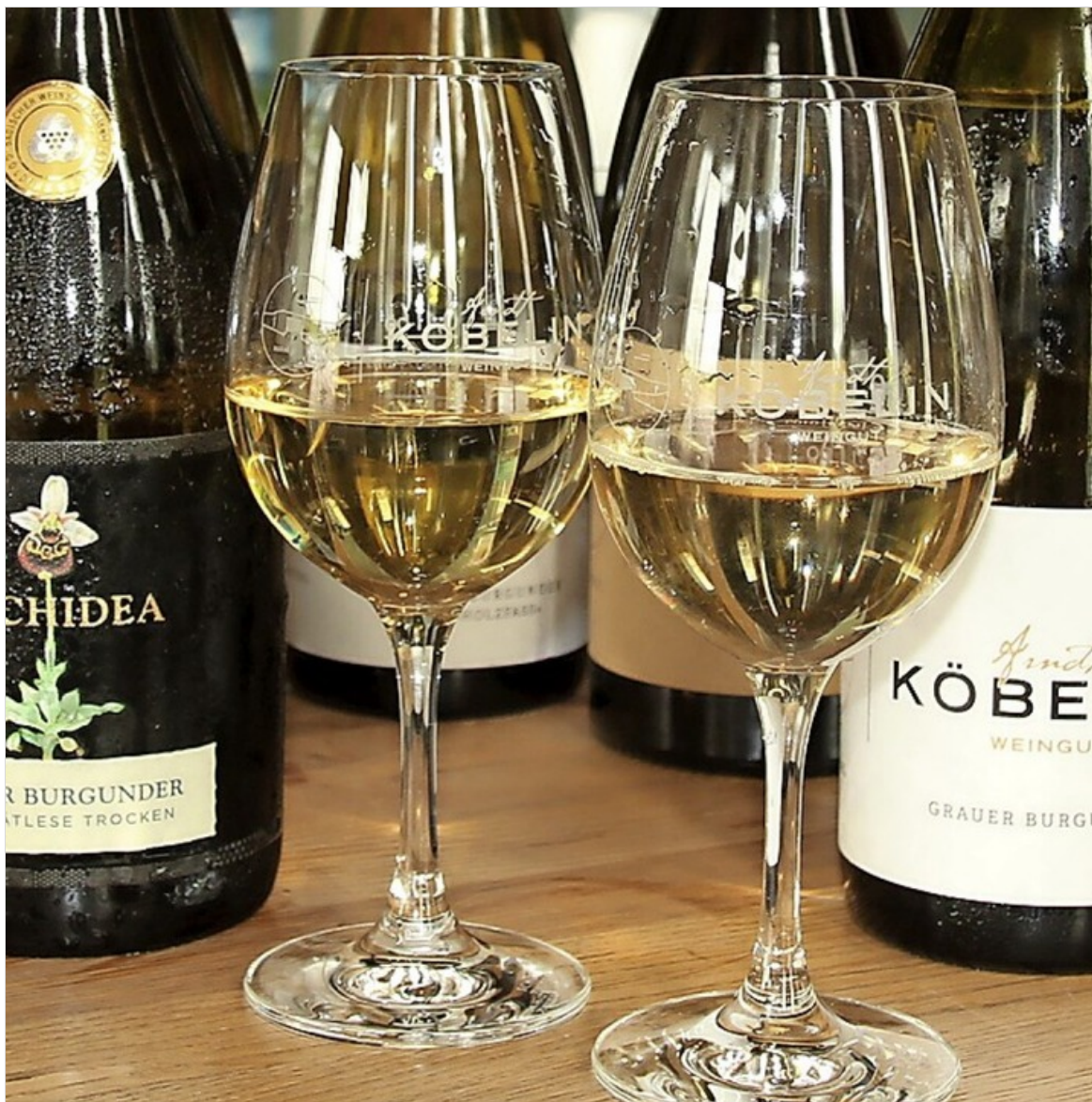
Hat eine große Bedeutung für die Region: der Grauburgunder

BZ-Plus | Preisverleihung findet am 10. Juli in Eichstetten statt.