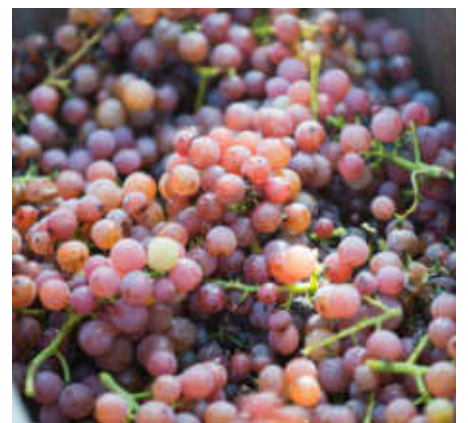
Pinot-gris-Trauben mit ihrer typischen Färbung.

Die Siegerehrung und Preisverleihung findet am 10. Juli 2021 statt, wobei Rahmen